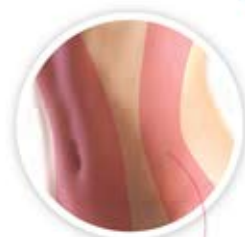
Abdomen (lateral y central)